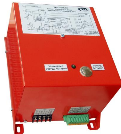
Рис. 1 Внешний вид БАО